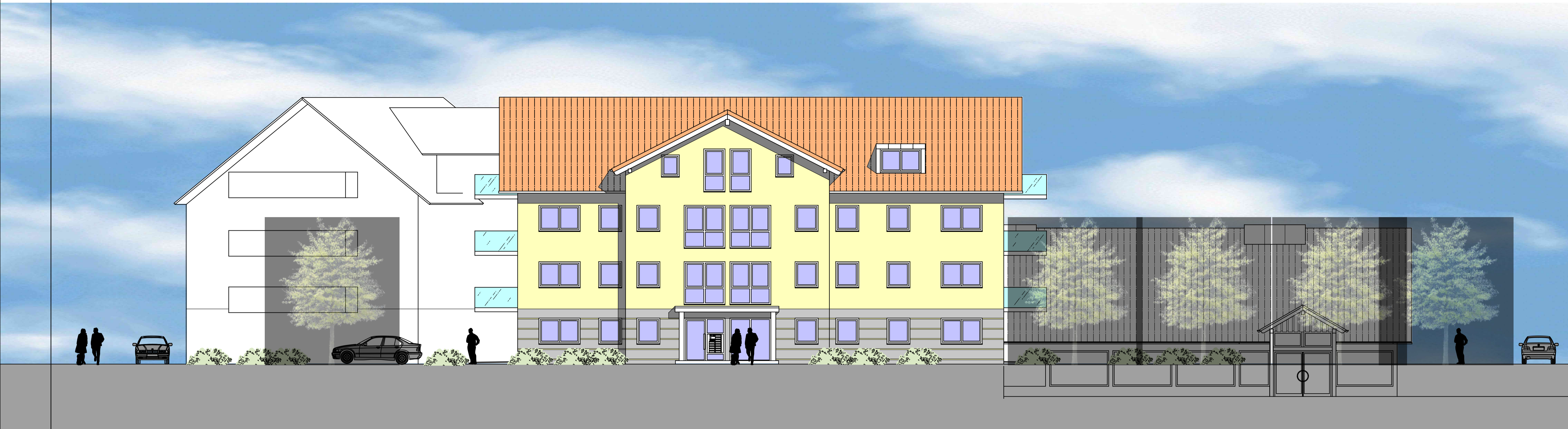
ANSICHT VON WESTEN HAUS 1