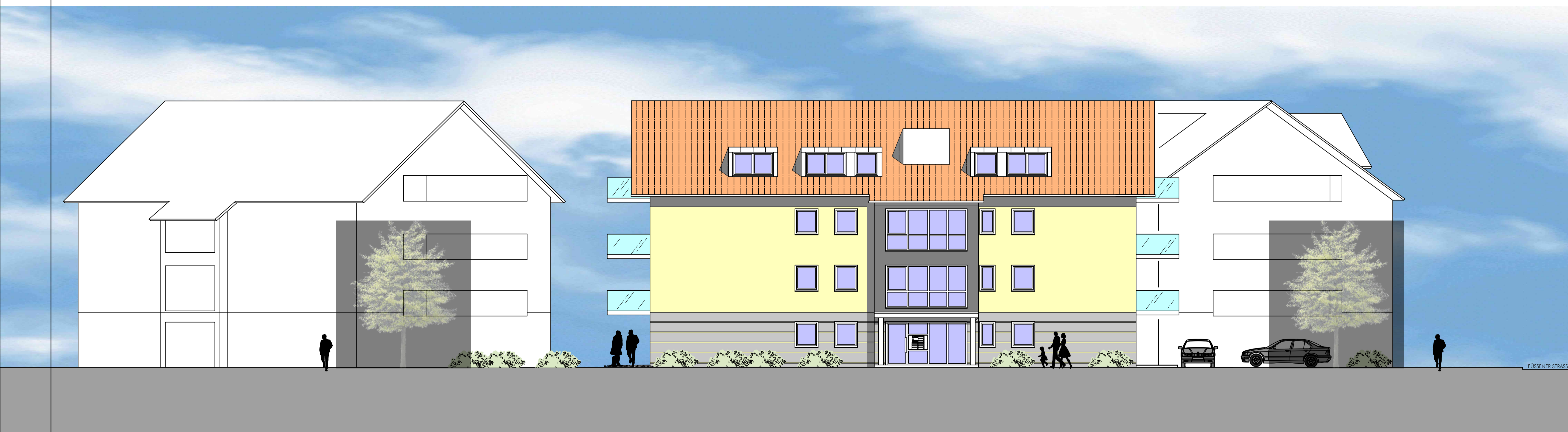
ANSICHT VON NORDEN HAUS 2

NEUBAU VON 3 MEHRFAMILIENHÄUSERN- 35 WE MIT TIEFGARAGE FÜSSENER STRASSE 17 87640 BIESENHOFEN