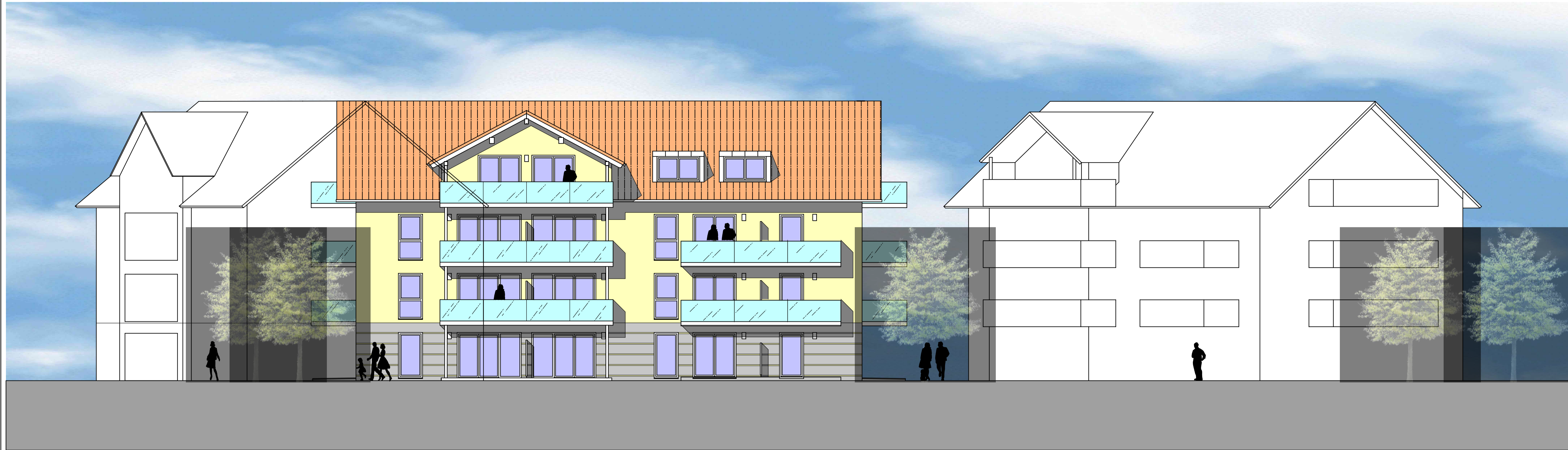
ANSICHT VON SÜDEN HAUS 2