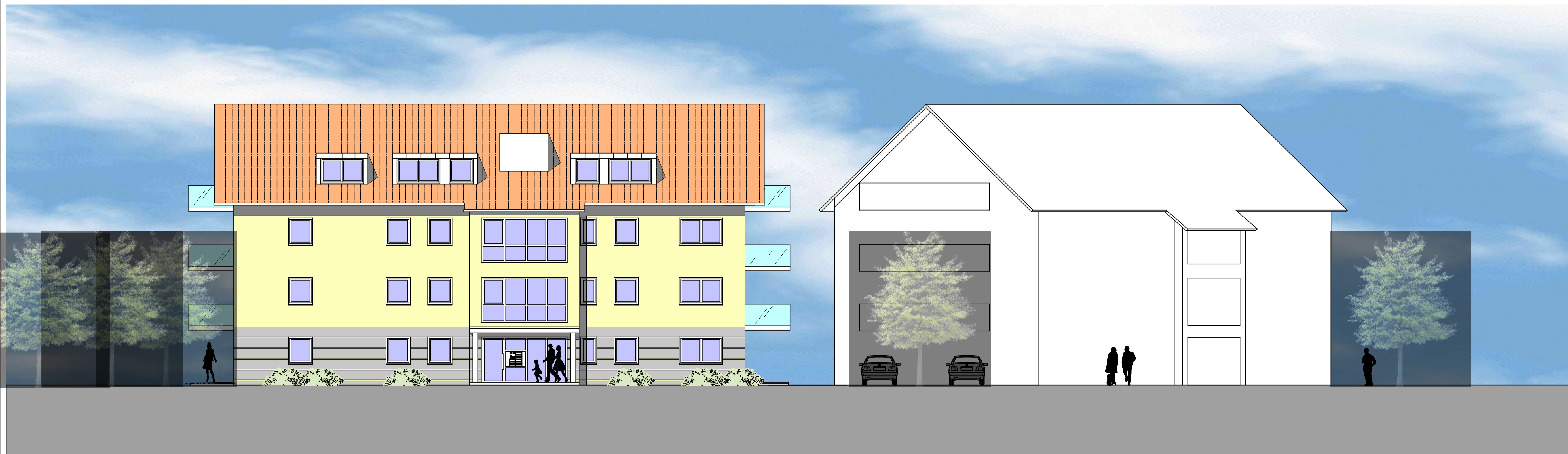
ANSICHT VON NORDOSTEN HAUS 3

NEUBAU VON 3 MEHRFAMILIENHÄUSERN- 35 WE MIT TIEFGARAGE FÜSSENER STRASSE 17 87640 BIESENHOFEN