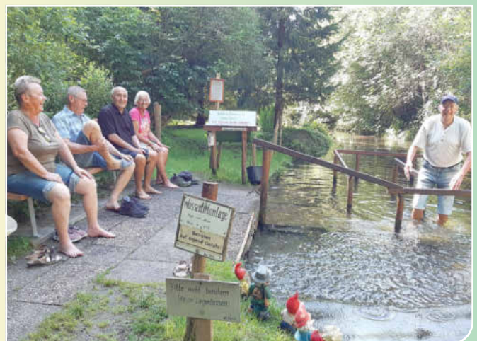
Das preisgekrönte Siegerfoto

Dazu sind alle Spaziergänger recht herzlich eingeladen, wir freuen uns ausdrücklich auch über viele neue Gesichter