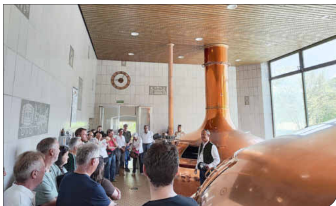
Die Lachparadenmitglieder während der Führung durch die Aktienbrauerei.