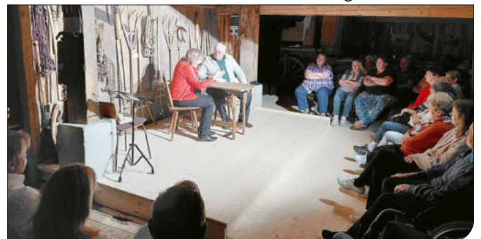
Auftritt des A`lb)Traumpaars im Baschtlehaus

So erlebten die Gäste in der voll besetzten Tenne des Baschtlehauses einen rundum vergnüglichen Abend mit einem bestens aufgelegten A`lb)Traumpaar, das einmal mehr unter Beweis stellte, warum es seit zwei Jahrzehnten zu den beliebtesten Kabarettduos des Allgäus zählt.