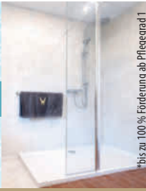
bis zu 100% Förderung ab Pflegegrad 1

Mehrfach ausgezeichnetes Handwerk | REGIONAL . ZUVERLÄSSIG . ERFAHREN